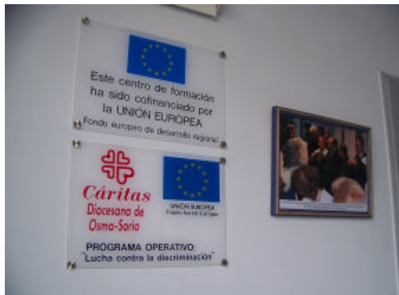
Placa ubicada en un centro de Cáritas