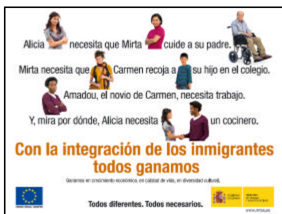
Valla de la campaña en pro de la integración de los inmigrantes de la Dirección General de Integración de los Inmigrantes

Por su parte, la Fundación ONCE publicará la Tira Cómica del Programa Operativo , que, con el objetivo de captar a las personas más jóvenes de una manera informal, tratará de hacer llegar el mensaje del PO de una manera didáctica y cercana. Para la elaboración del mismo se contará con la colaboración de dibujantes de prestigio, que ayuden a popularizarla.