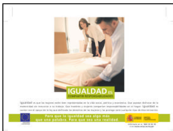
Cartel de la "Campaña por la Igualdad" del Instituto de la Mujer

El Instituto de la Mujer realizará la máxima difusión posible de las actuaciones concretas desarrolladas en el PO, y de la contribución financiera del FSE, aprovechando los medios de comunicación, con campañas publicitarias en televisión, prensa escrita, radio, televisión o Internet.