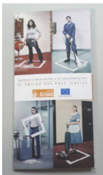
Tríptico de la campaña de sensibilización "Rompiendo barreras", editado por la Fundación Secretariado Gitano

Cruz Roja llevará a cabo campañas de información sobre los beneficios que puede aportar a la empresa el trabajo de los más vulnerables, dirigidas a empresas y trabajadores; invitará a los responsables de recursos humanos a jornadas, seminarios y sesiones del desarrollo del Plan de Empleo; convocará ruedas de prensa a través de convenios conjuntos; llevará a cabo reconocimientos y actuaciones de fidelización para empresas colaboradoras en el Plan de Empleo; etc.