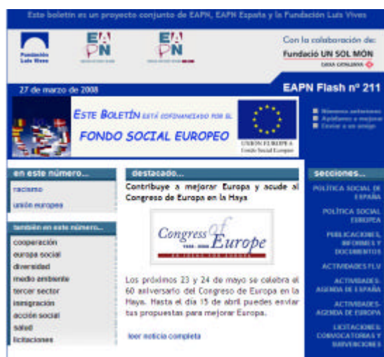
Boletín electrónico EAPN Flash, editado por la Fundación Luis Vives

Cruz Roja Española explotará su página web como medio de difusión a los potenciales beneficiarios, dedicando un microsite a las actuaciones de Cruz Roja en el marco del PO y editará un Boletín Oficial donde se informará sobre el contenido, las novedades y la actualidad de las intervenciones.