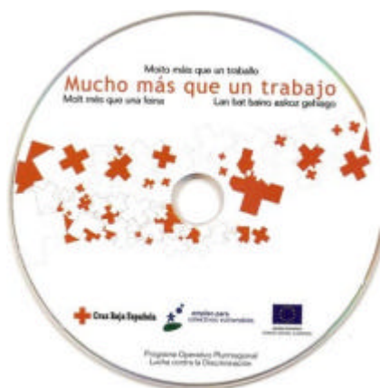
DVD editado por Cruz Roja