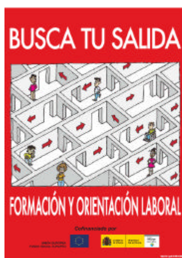
Cartel relativo a los programas de formación y orientación laboral gestionados por OATPFE

El Organismo Autónomo de Trabajo Penitenciario y Formación para el Empleo editará carteles y trípticos para dar a conocer las actividades del PO a las organizaciones, empresas o agentes sociales que puedan favorecer la inserción laboral del colectivo de personas privadas de libertad o en libertad condicional.