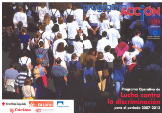
Portada y contraportada de la revista ProgramaAcción de la Fundación ONCE

potenciará su aparición en aquellos periódicos, revistas o boletines en los que, por su colectivo meta o impacto social, la difusión obtenga un efecto multiplicador; y una revista semestral, que contendrá las distintas separatas realizadas hasta el momento y un monográfico, a modo de balance, sobre la ejecución anual del PO.