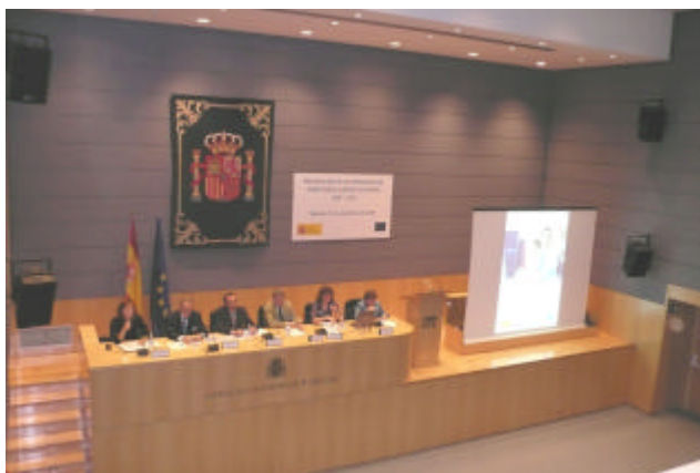
Acto de presentación de los programas operativos organizado por la UAFSE

La UAFSE organizó el pasado 27 de noviembre un acto institucional de presentación de todos los programas operativos regionales y plurirregionales del FSE de aplicación en España en el nuevo periodo de programación 2007-2013 21 . Dicho acto, que supuso el lanzamiento oficial del Programa Operativo de Lucha contra la Discriminación, contó con la participación activa de una representación de los Organismos Intermedios implicados en la gestión del mismo.