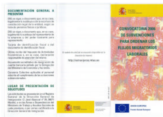
Folleto informativo sobre las subvenciones gestionadas por la Dirección General de Inmigración