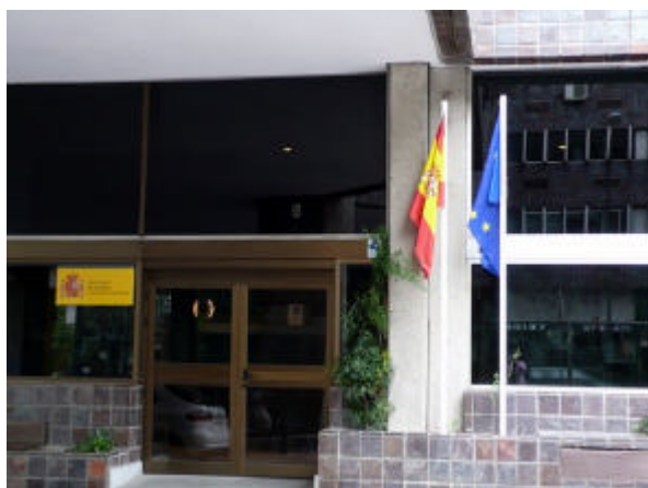
Izado de la bandera de la UE en los locales de la UAFSE