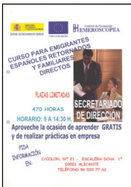
Anuncio relativo a las operaciones gestionadas por la Dirección General de Emigración