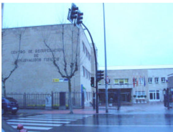
Centro del IMSERSO donde se desarrollaron actividades cofinanciadas