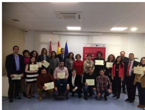
Clausura Team Mix Madridejos, Cámara de Comercio de Toledo, Castilla La Mancha.