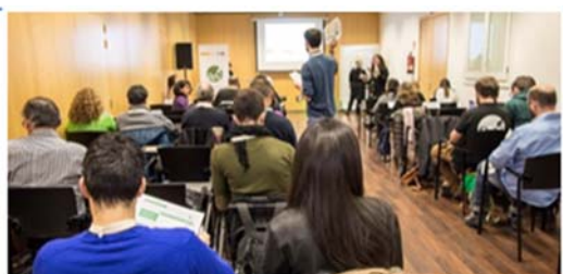
Jornada Conecta Circular (Programa con emprendedores) en Barcelona