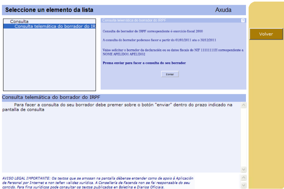
Figura 6. Axuda á Consulta Telemática do borrador do IRPF

Á esquerda da pantalla sitúase unha lista de opcións que da paso á segunda pantalla de axuda, premendo sobre "Consulta telemática do recadro do IRPF". Esta pantalla pode verse na Figura 6 .