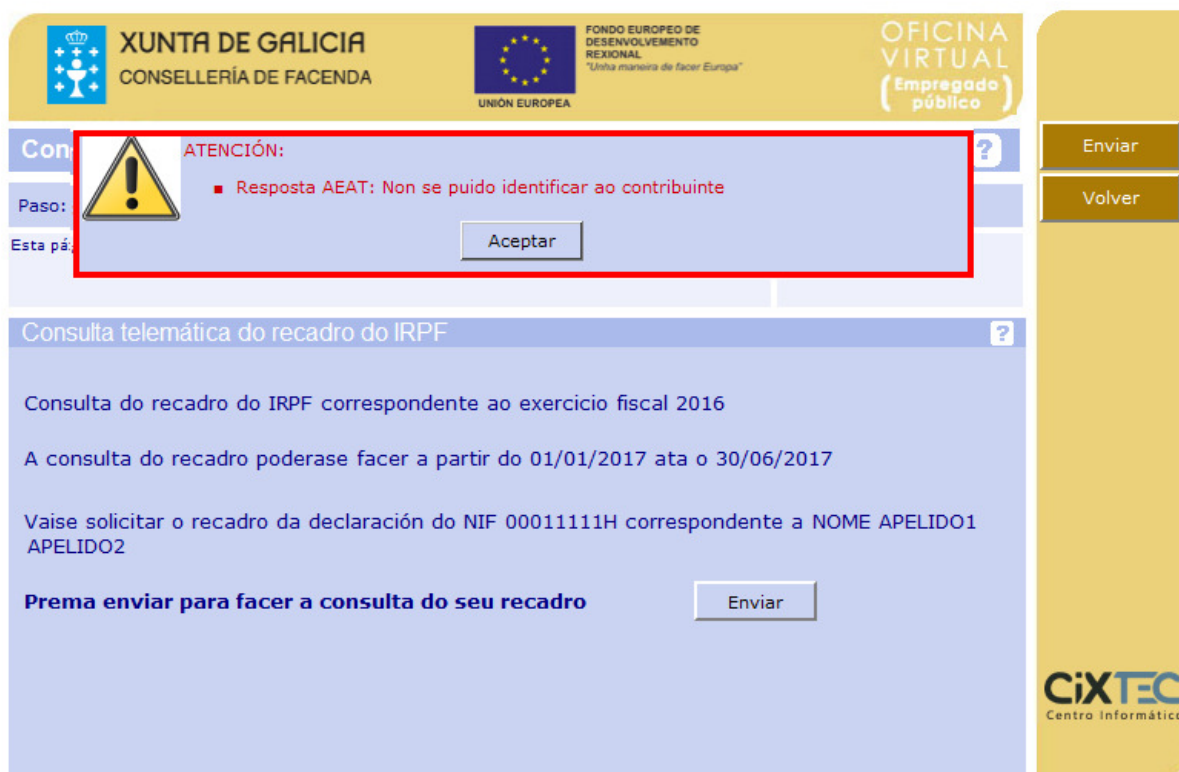
Figura 3. Mensaxe de resposta da AEAT

No caso de que o servizo da AEAT retorne algún erro indicárase mediante unha mensaxe de alerta.