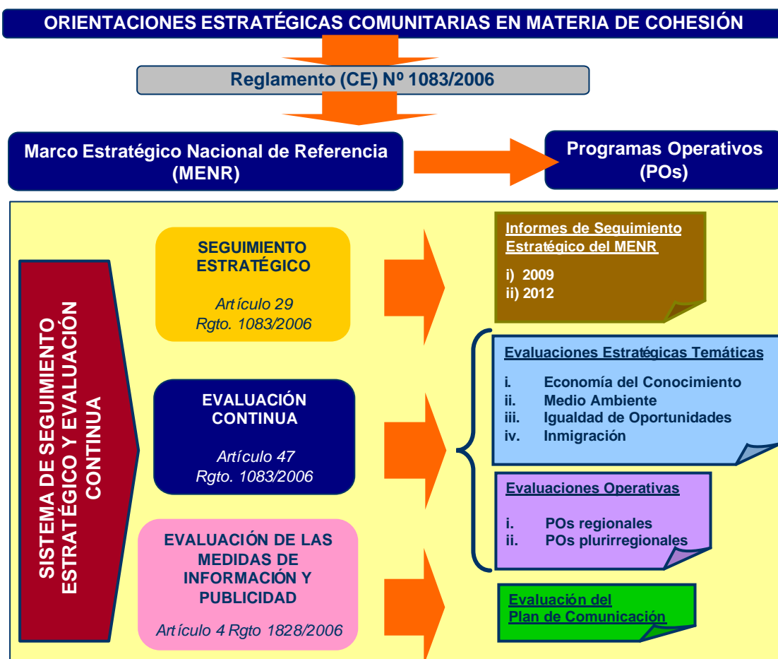
Esquema 1. Periodo de Programación 2007-2013. Seguimiento Estratégico y Evaluación Continua.

En el marco de los compromisos adquiridos por las Autoridades de Gestión de los Fondos (FEDER, FC y FSE), el presente documento constituye una guía para establecer un marco común de trabajo y unas orientaciones metodológicas para abordar los retos y requerimientos comunitarios en materia de seguimiento estratégico.