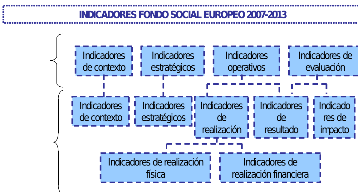
Fig 1: clasificación de los indicadores a utilizar en Fondo Social Europeo 2007-2013:

En función de su utilidad , el sistema de indicadores diseñado para utilizar en los Programas Operativos de Fondo Social Europeo se divide en tres grupos de indicadores que son el grupo de indicadores estratégicos, el de indicadores operativos y, por último, el grupo de indicadores de evaluación. 5 Cada uno de estos grupos se compone de uno o más tipos de indicadores, de diferente naturaleza (ver fig.1):